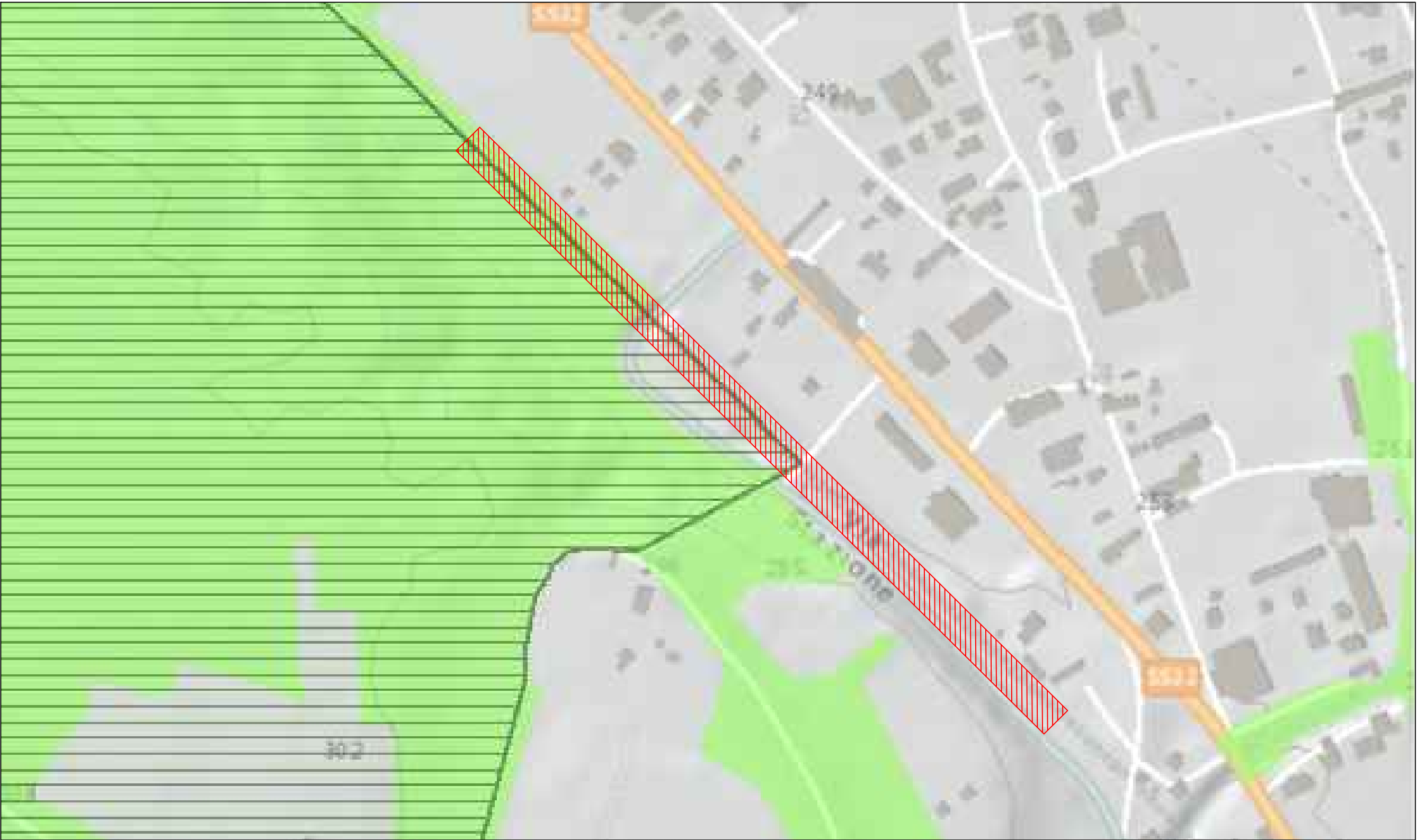
PIANO PAESAGGISTICO REGIONALE - P2 BENI PAESAGGISTICI