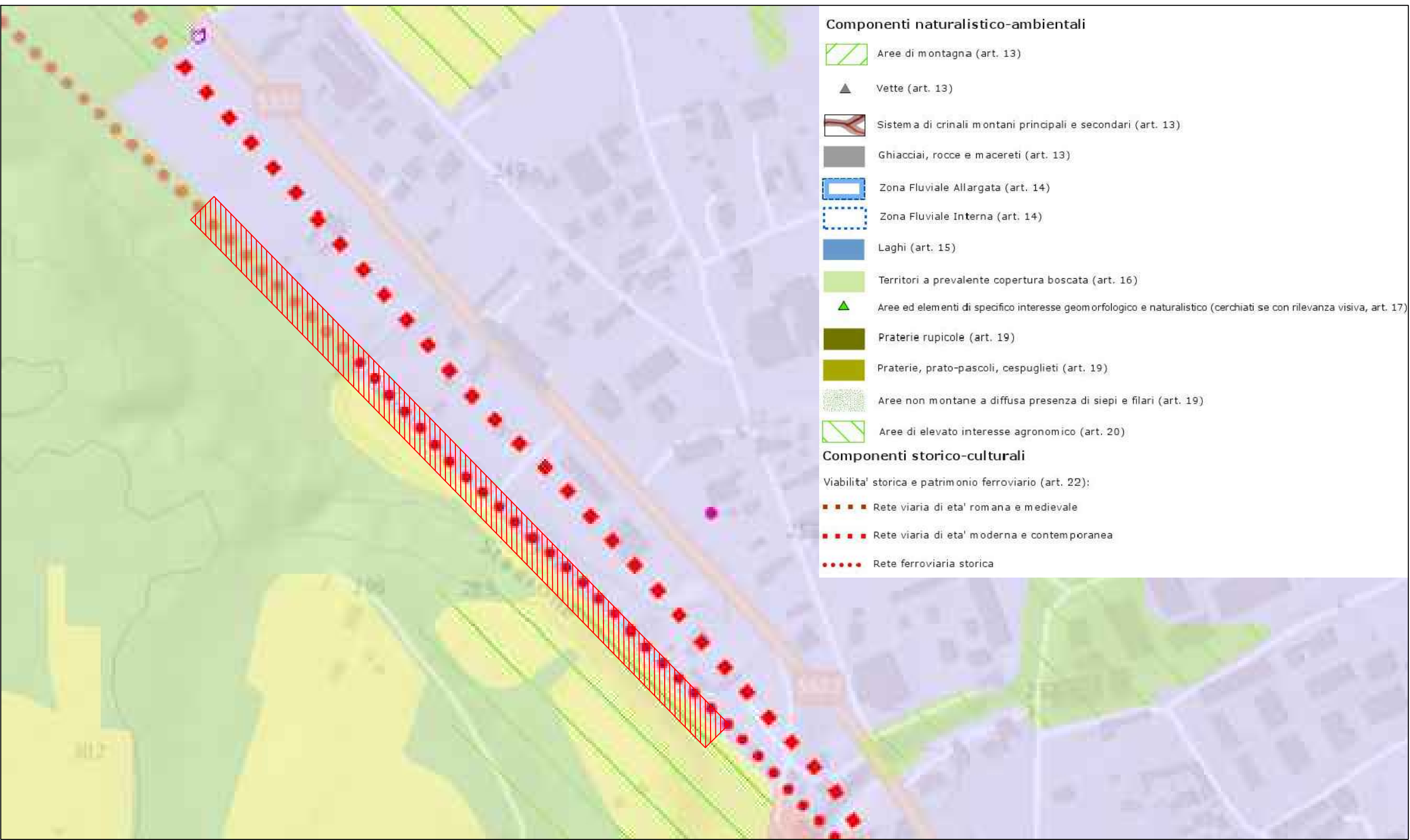
PIANO PAESAGGISTICO REGIONALE - P4 COMPONENTI PAESAGGISTICHE